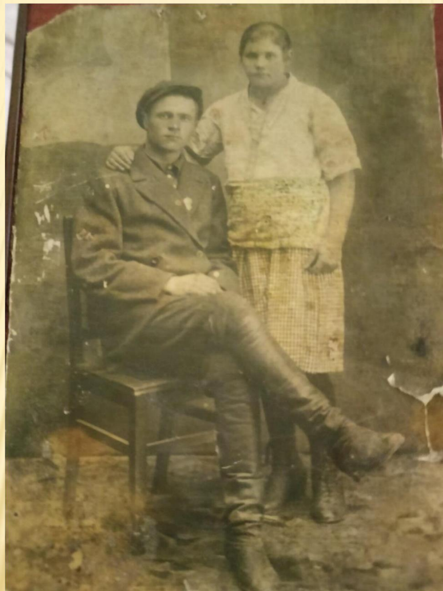
Михайловский район, хутор Раковка (1930-е гг., Сталинградская область)