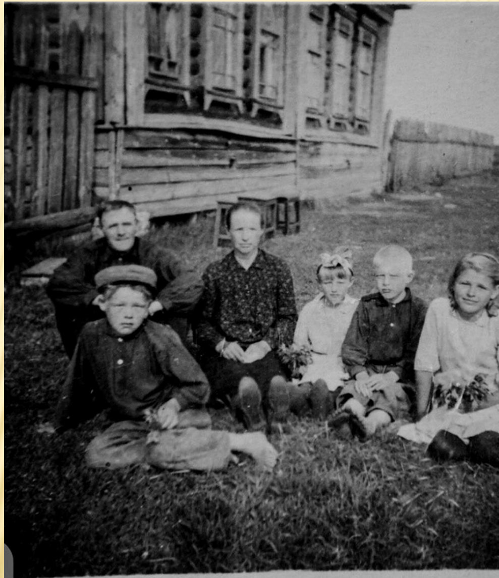
Семья Шимановых из села Бурундуки (Татарстан, 1930-е гг.)