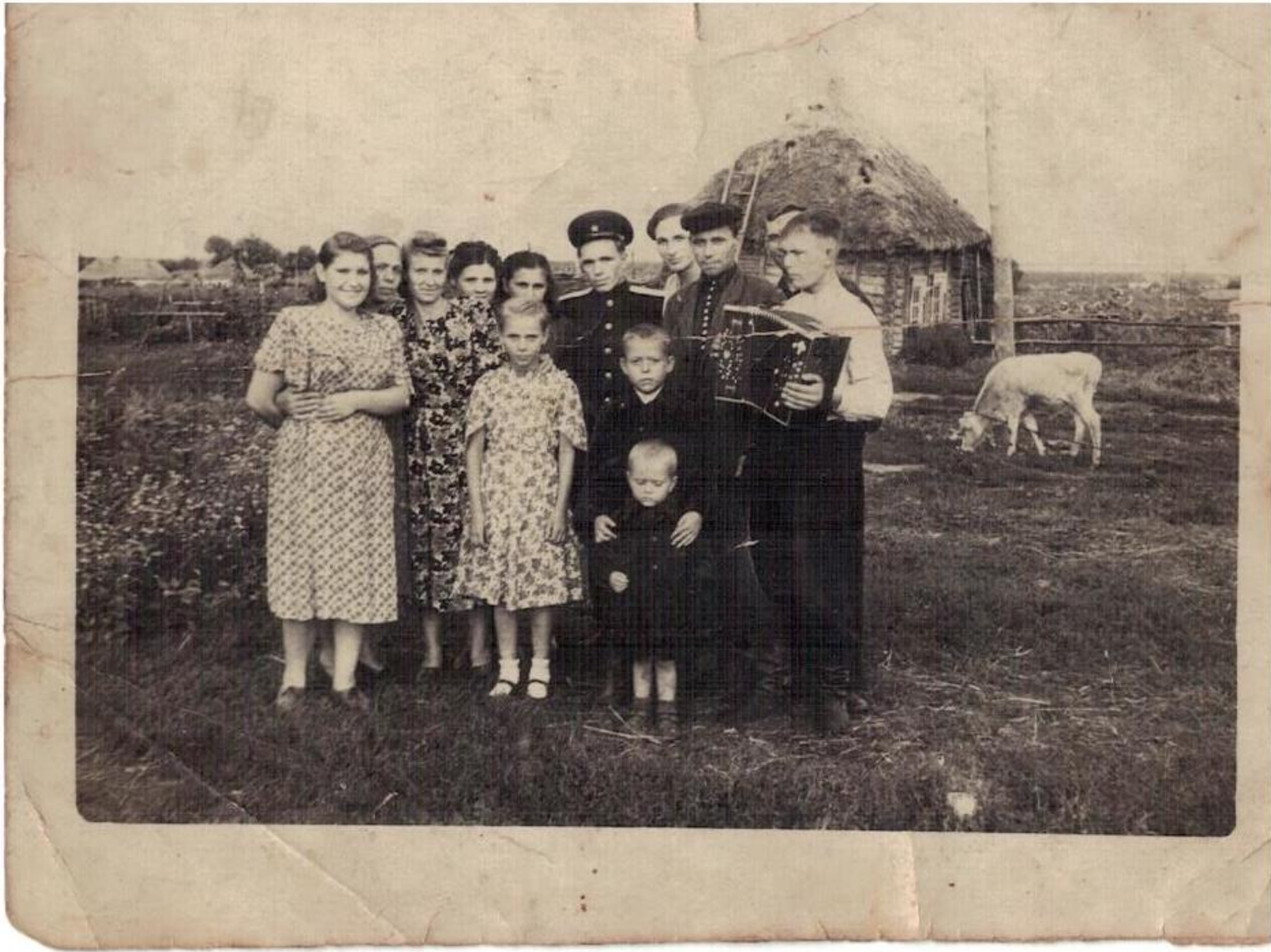
Жители д.Радостное. Фото сделано в 1950 - е гг.