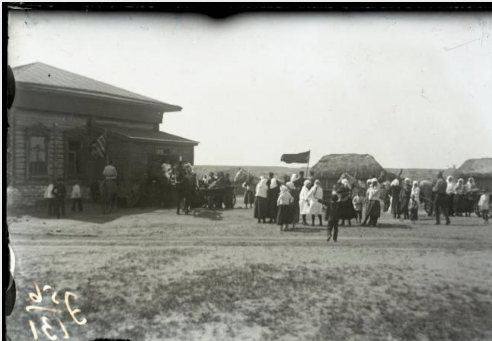
Свадьба в селе Репное. Балашовский район, май-июнь 1930 г.