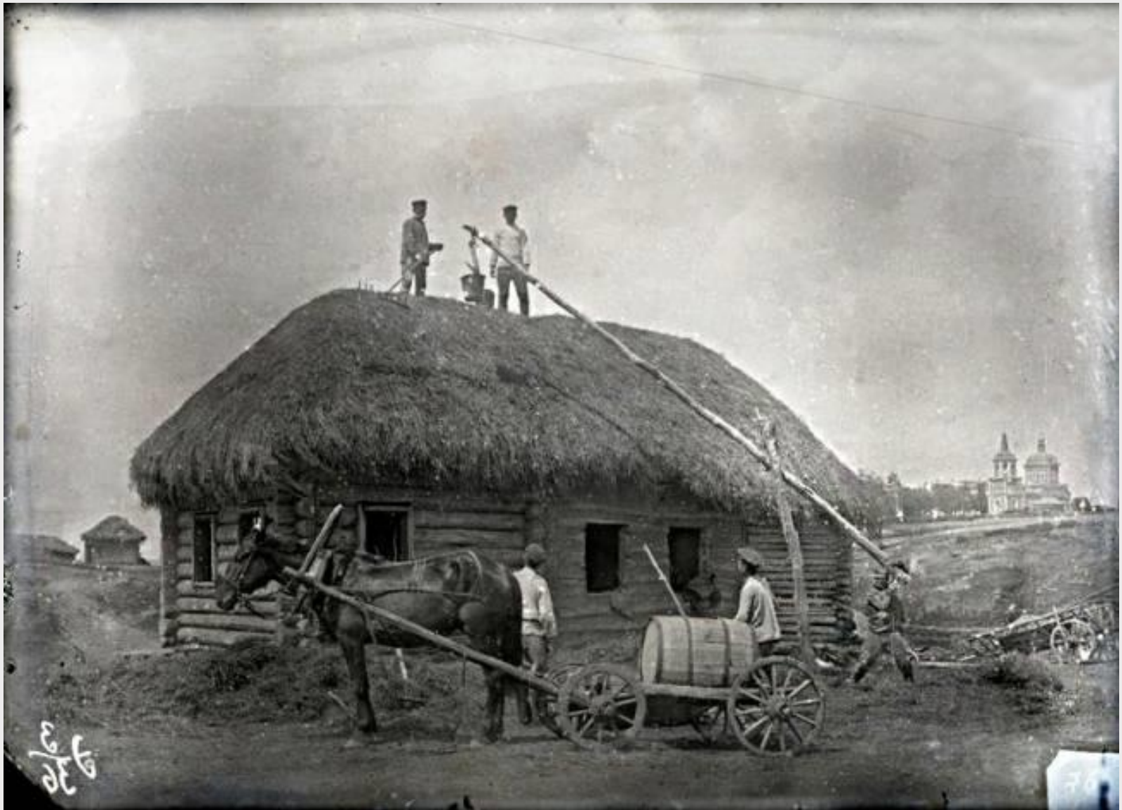
Село Ключёвка Саратовской губернии. Июль 1923 г.