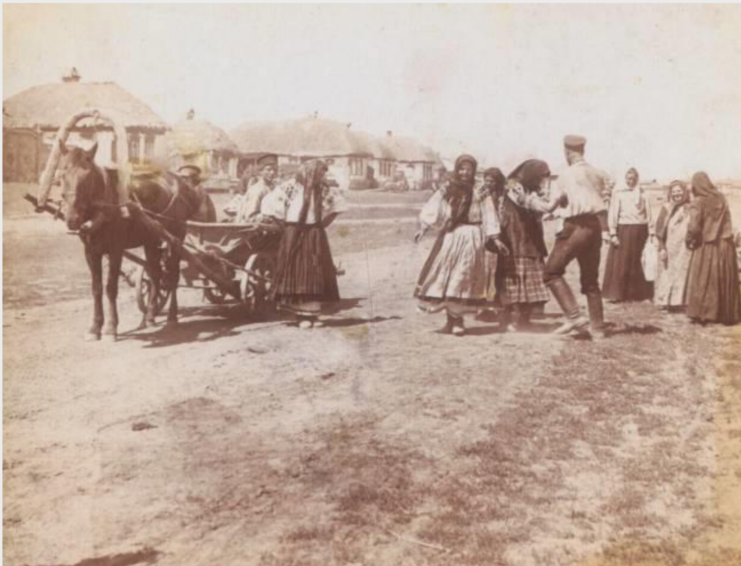
Село Баланды. Июль 1924 г.