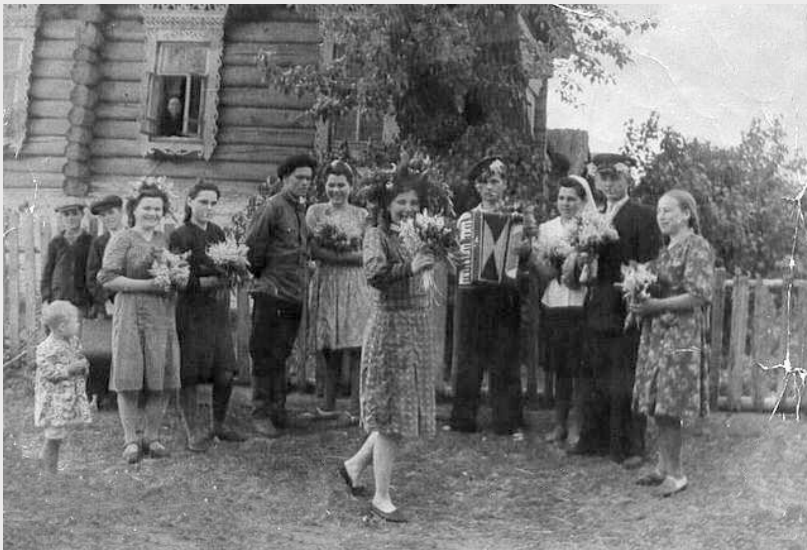
Уличные гуляния в селе Каргино Вешкаймского района, 1930 г.