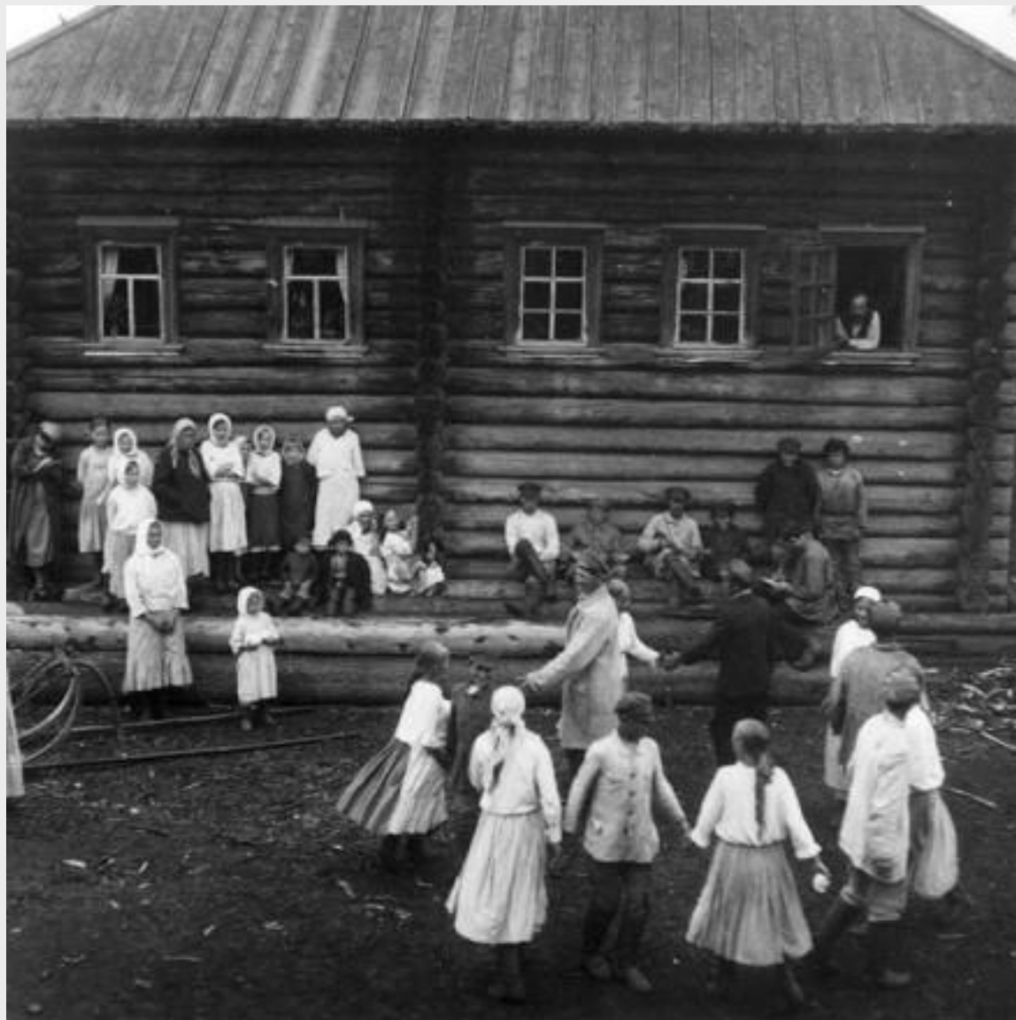
Деревенский праздник. 1920 г.