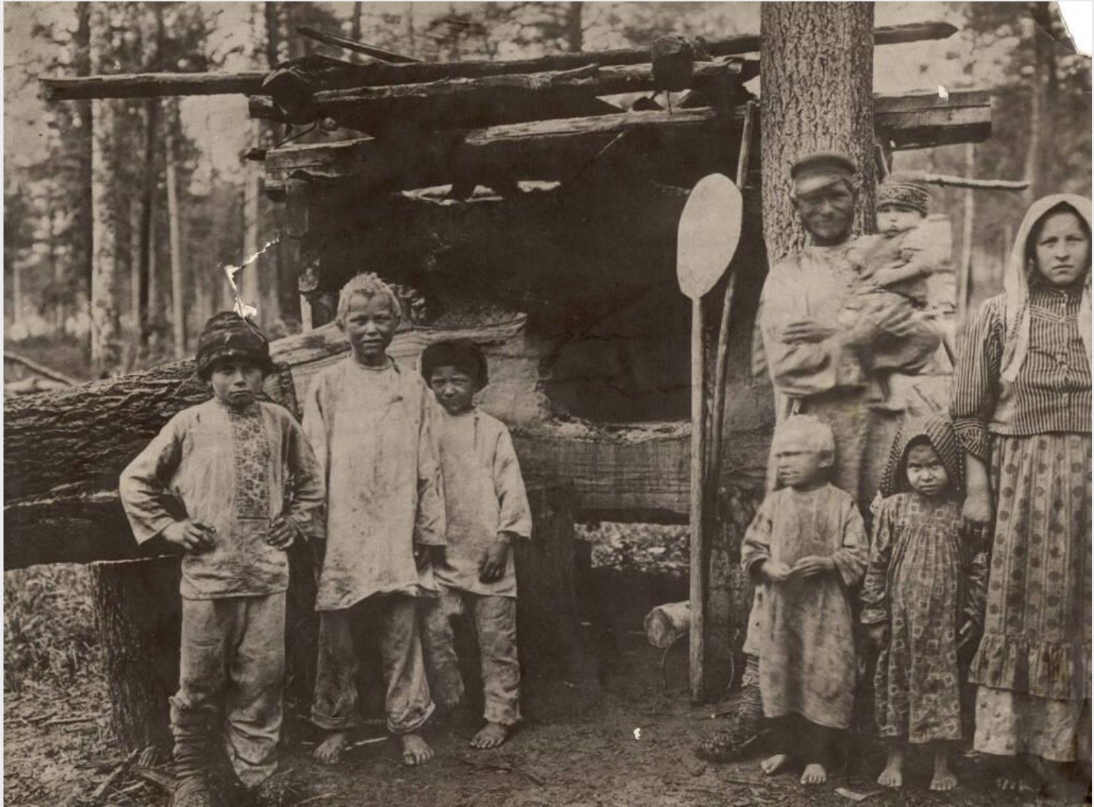
Переселенцы. Енисейская губерния, 1910 г.