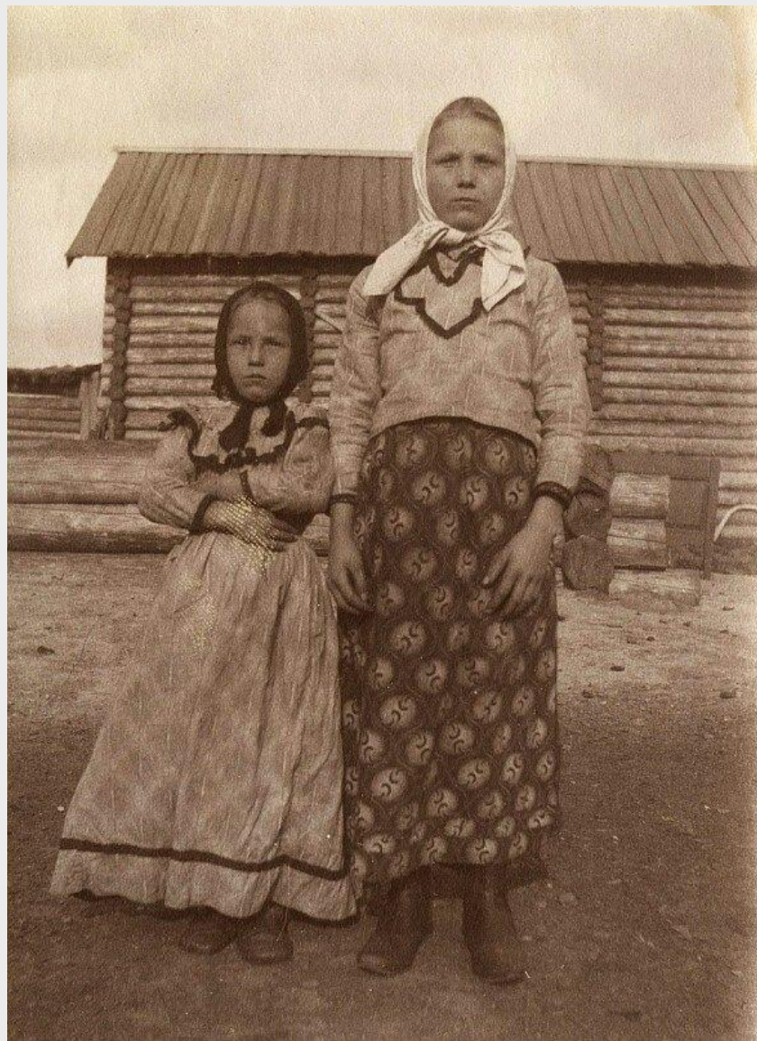
Девочки-крестьянки из д. Ярки Енисейского уезда в праздничной одежде. Август 1912 г.