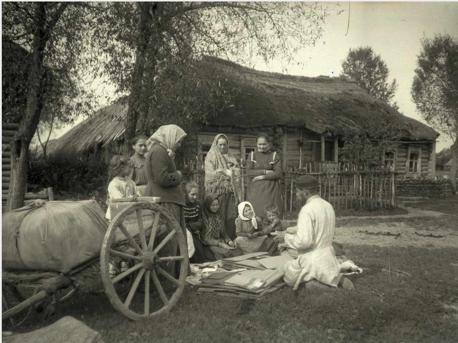
Орловские крестьяне начала XX века.