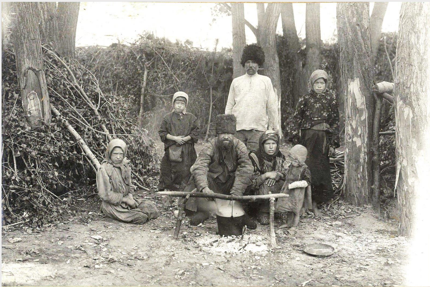
Поволжье. 1921 г.