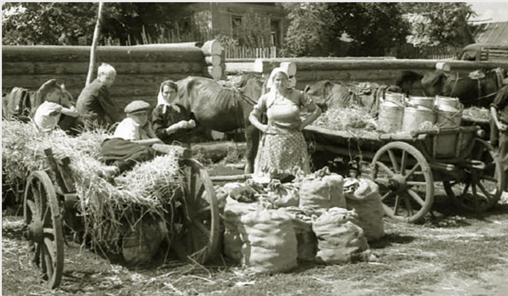
Краснослободский рынок, 1930 г.