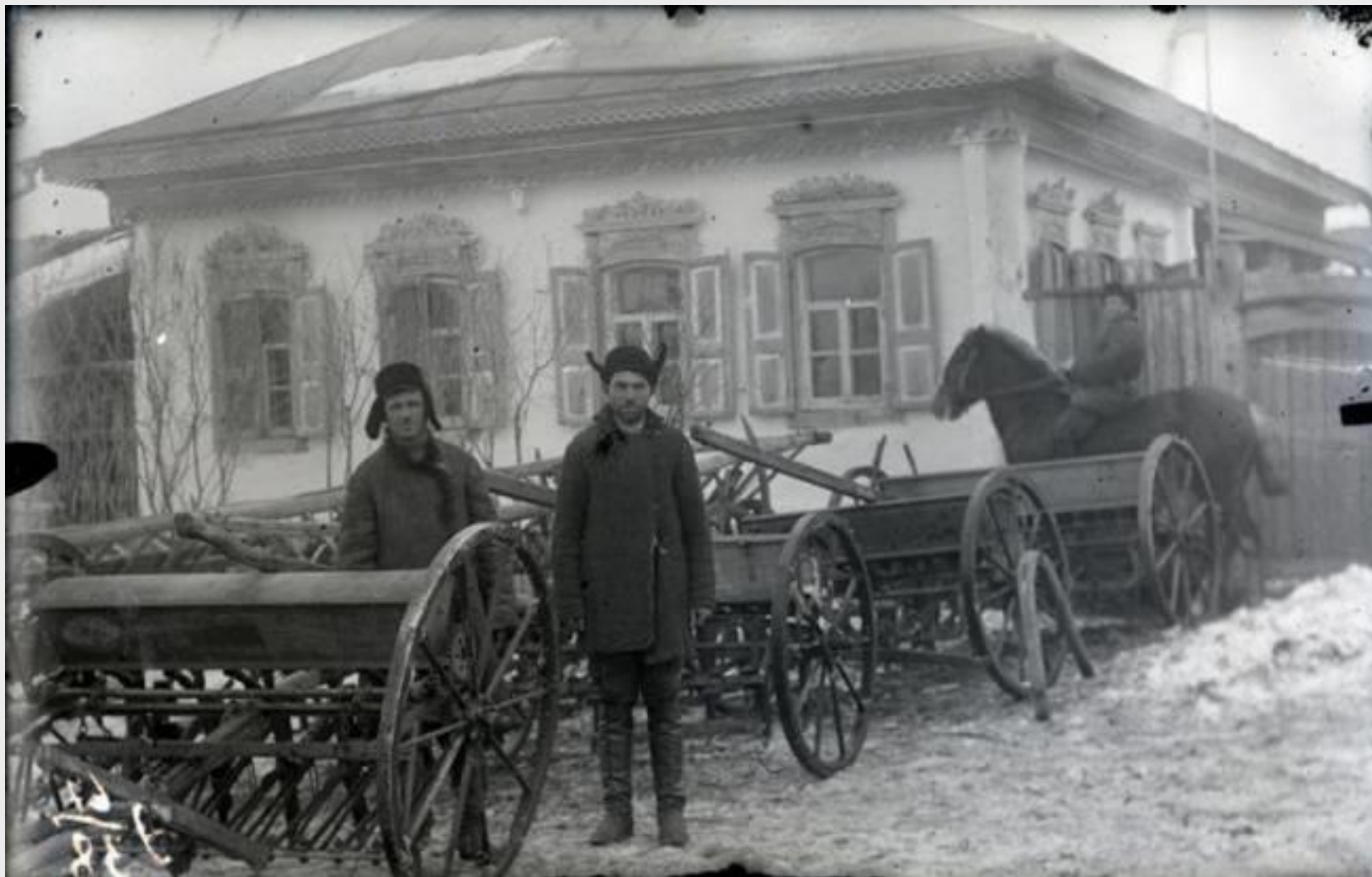
Село Самойловка, 1930 г.