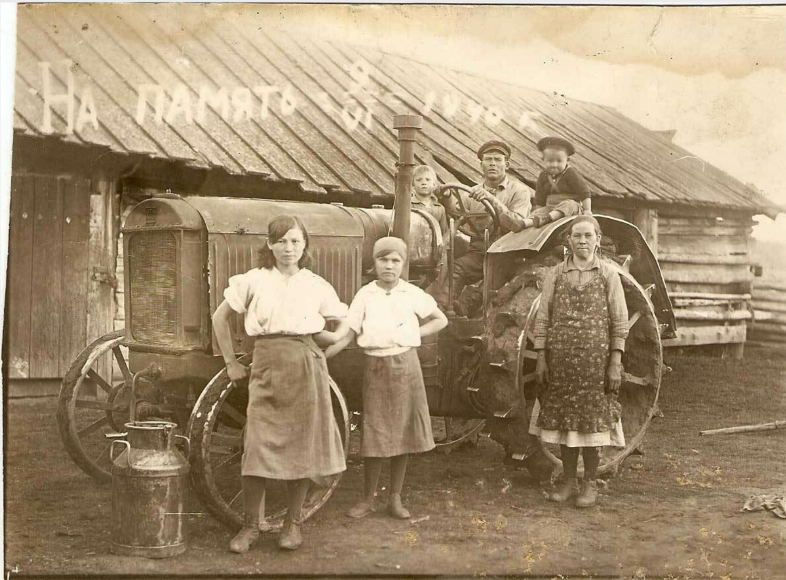
Крестьяне одной из восточносибирских деревень, 1930 г.