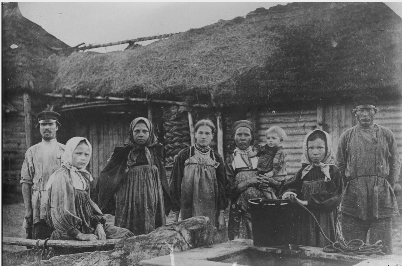
Переселенцы в Приморье. 1910 г.