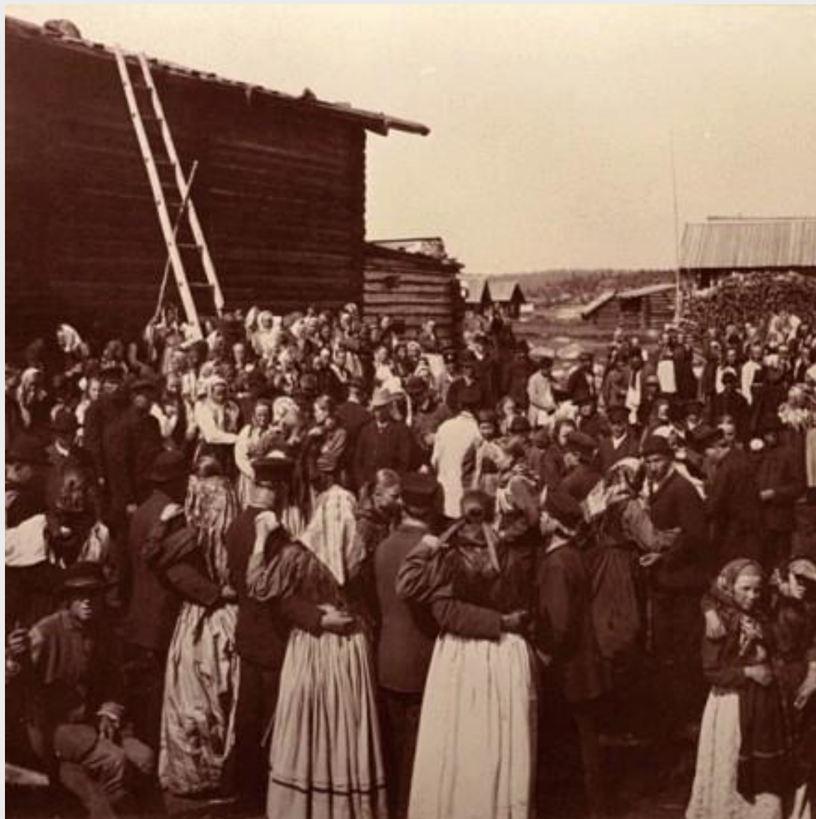
Танцы на праздник. Карелия, 1920 г.