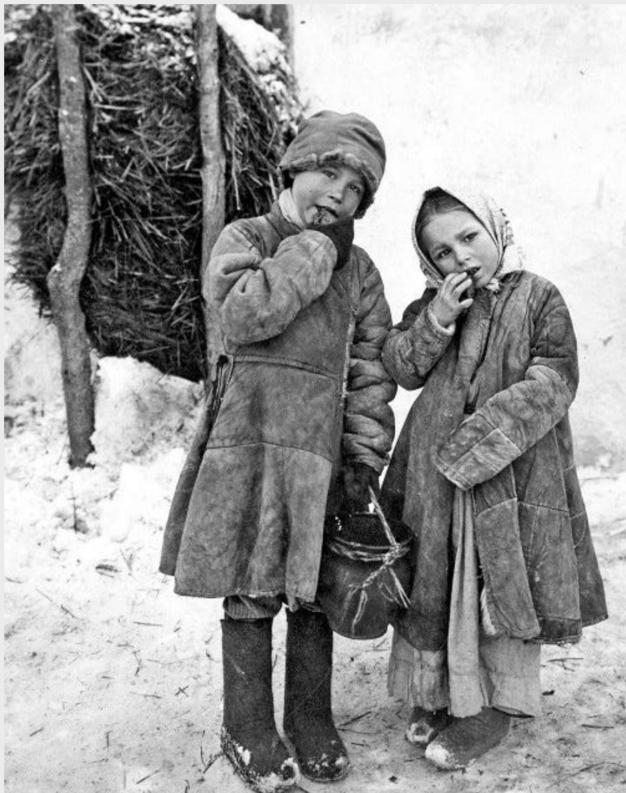
Крестьянские дети. Село Ново-Семейкино, Самарский уезд. Начало XX века.