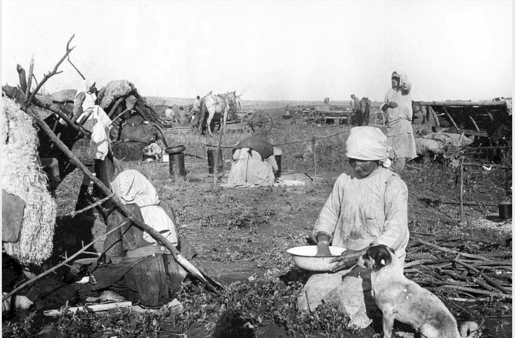
Крестьяне Самарской губернии. 1910 г.