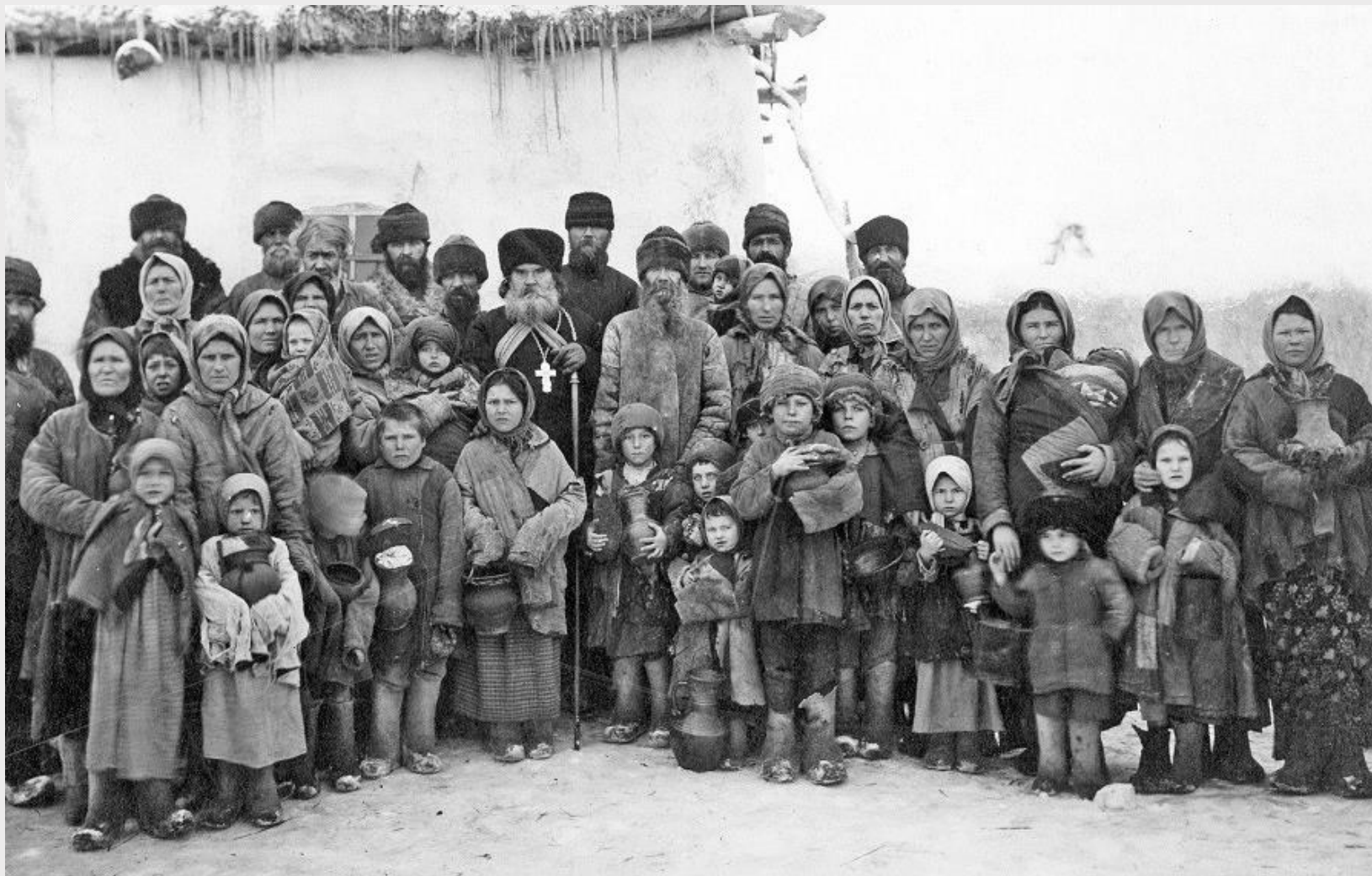
Группа крестьян села Ново-Семейкино Самарского уезда, 1910 г.