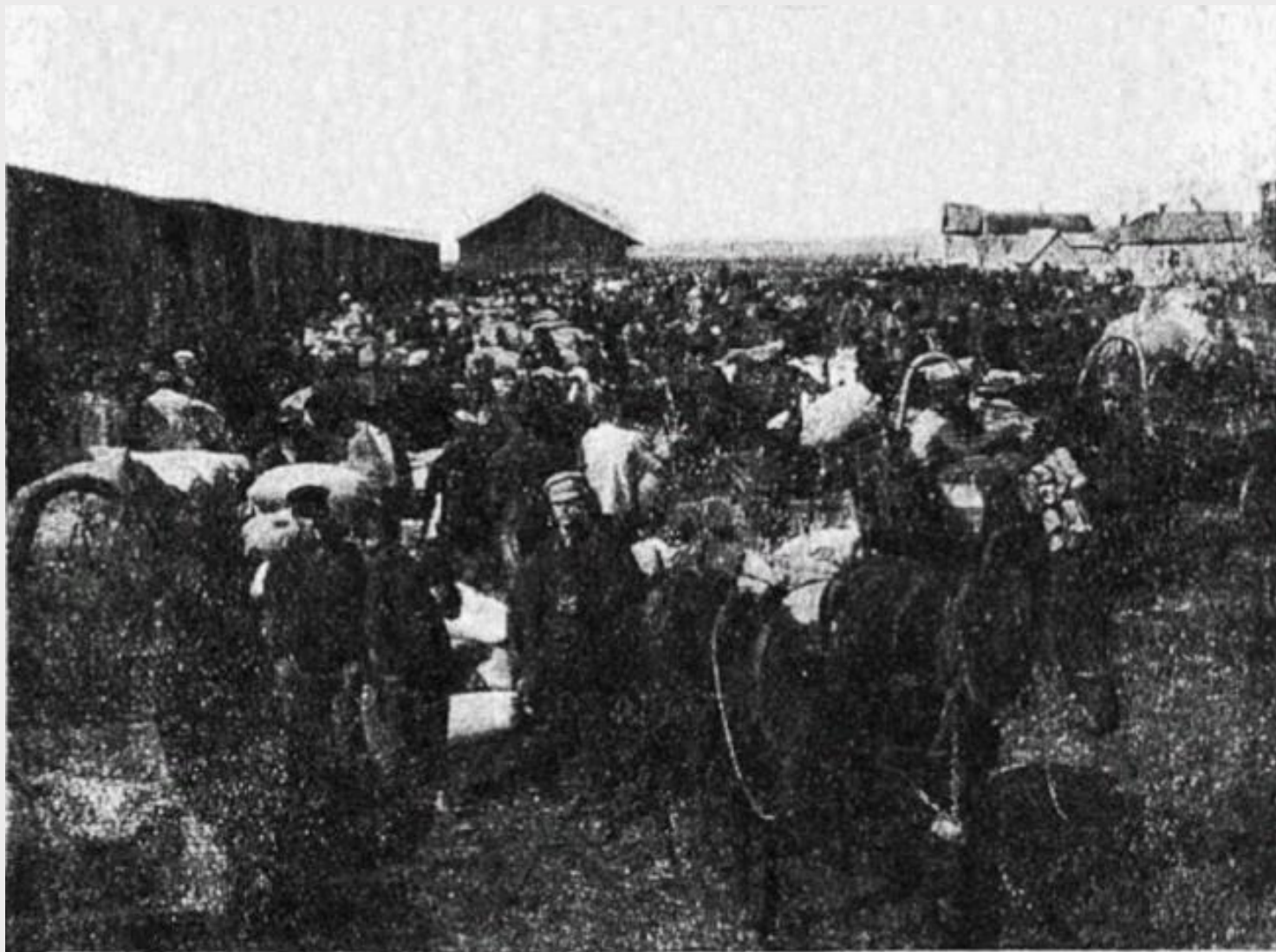
За семенной ссудой в г-р. Покровске.