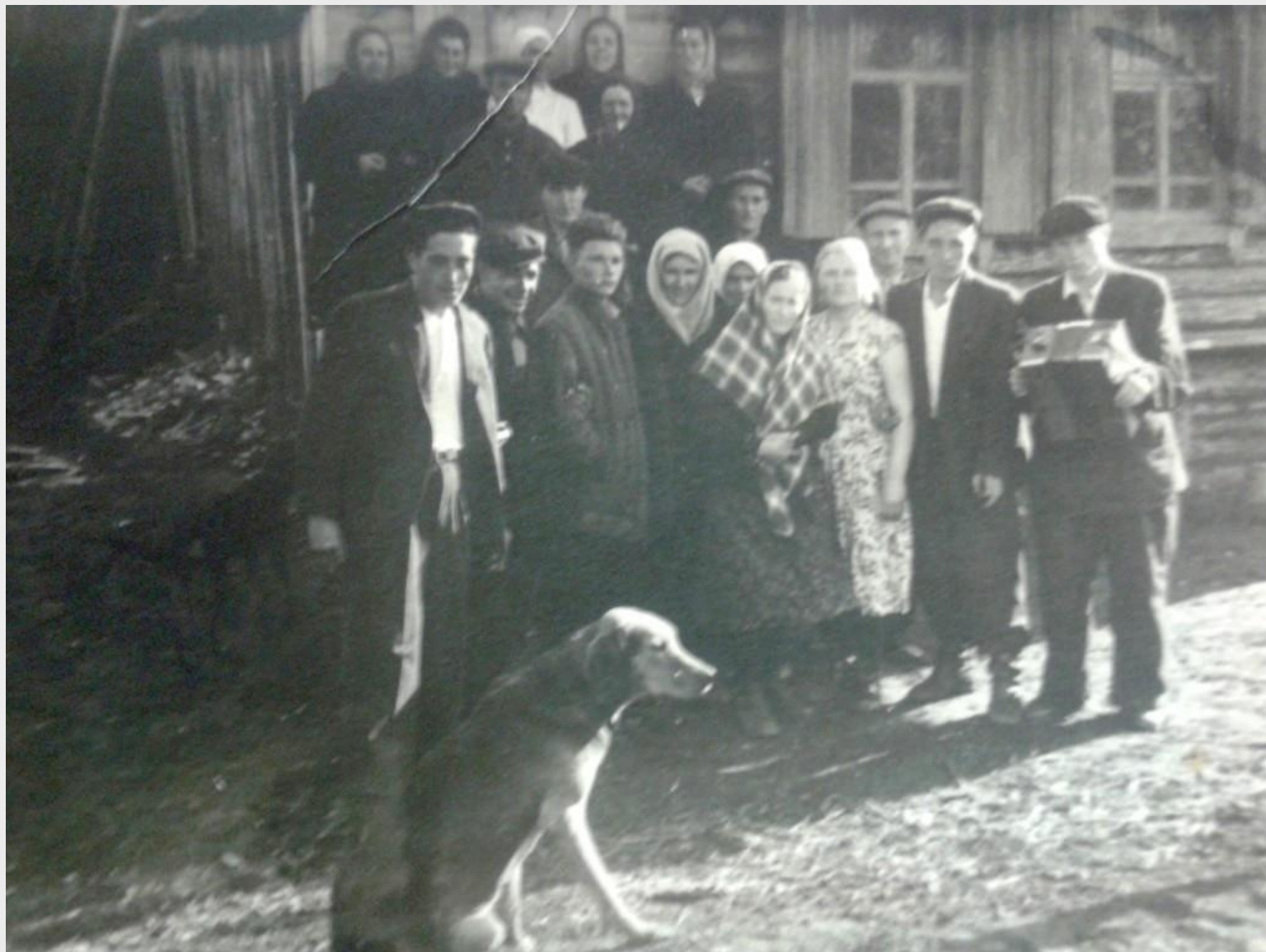
Жители села Каргино. Вешкаймский район, 1930 г.