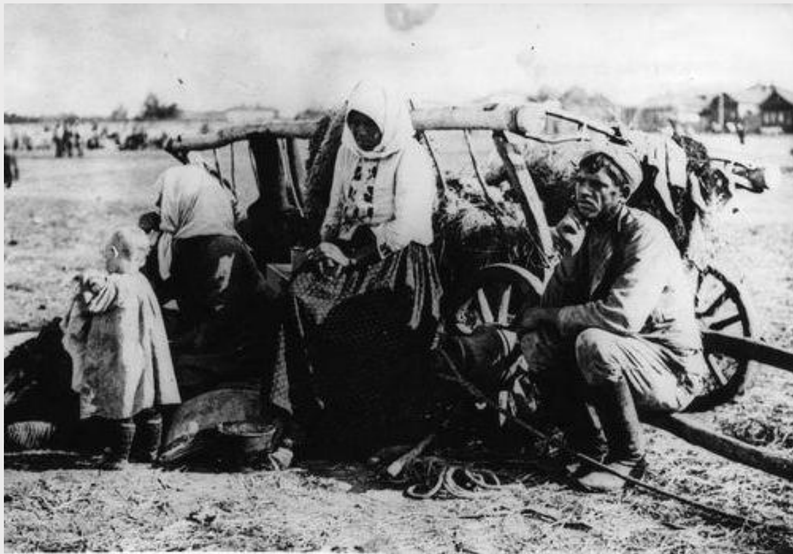
Семья из Поволжья. 1921 г.