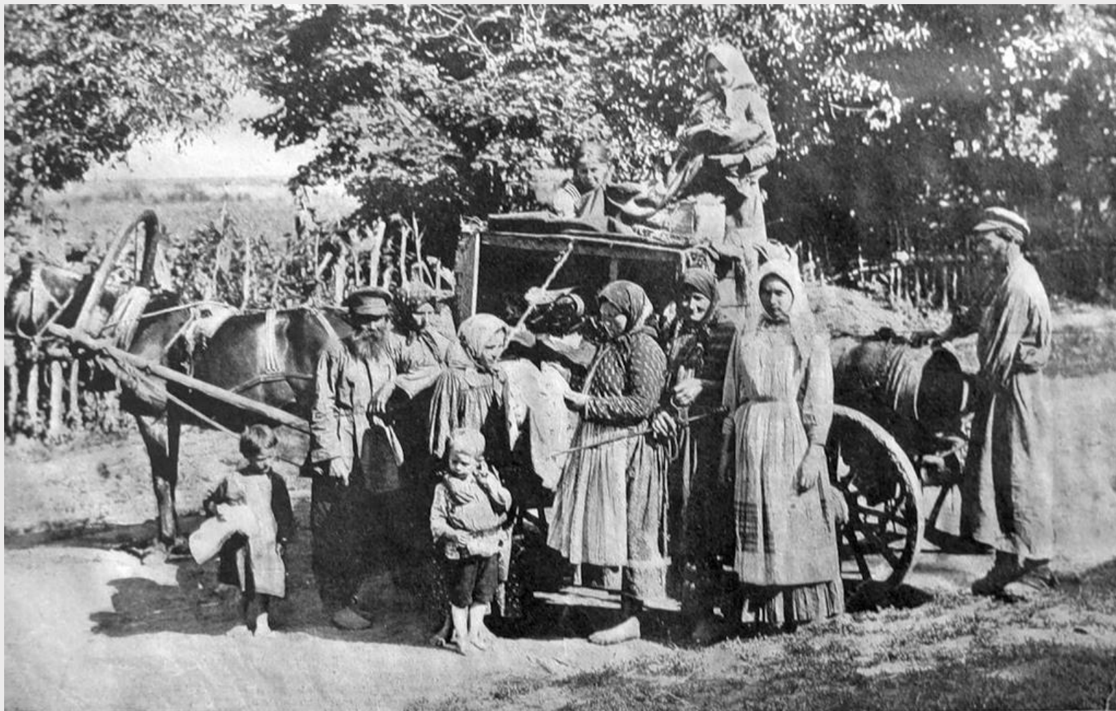
Коробейники. 1915 г.