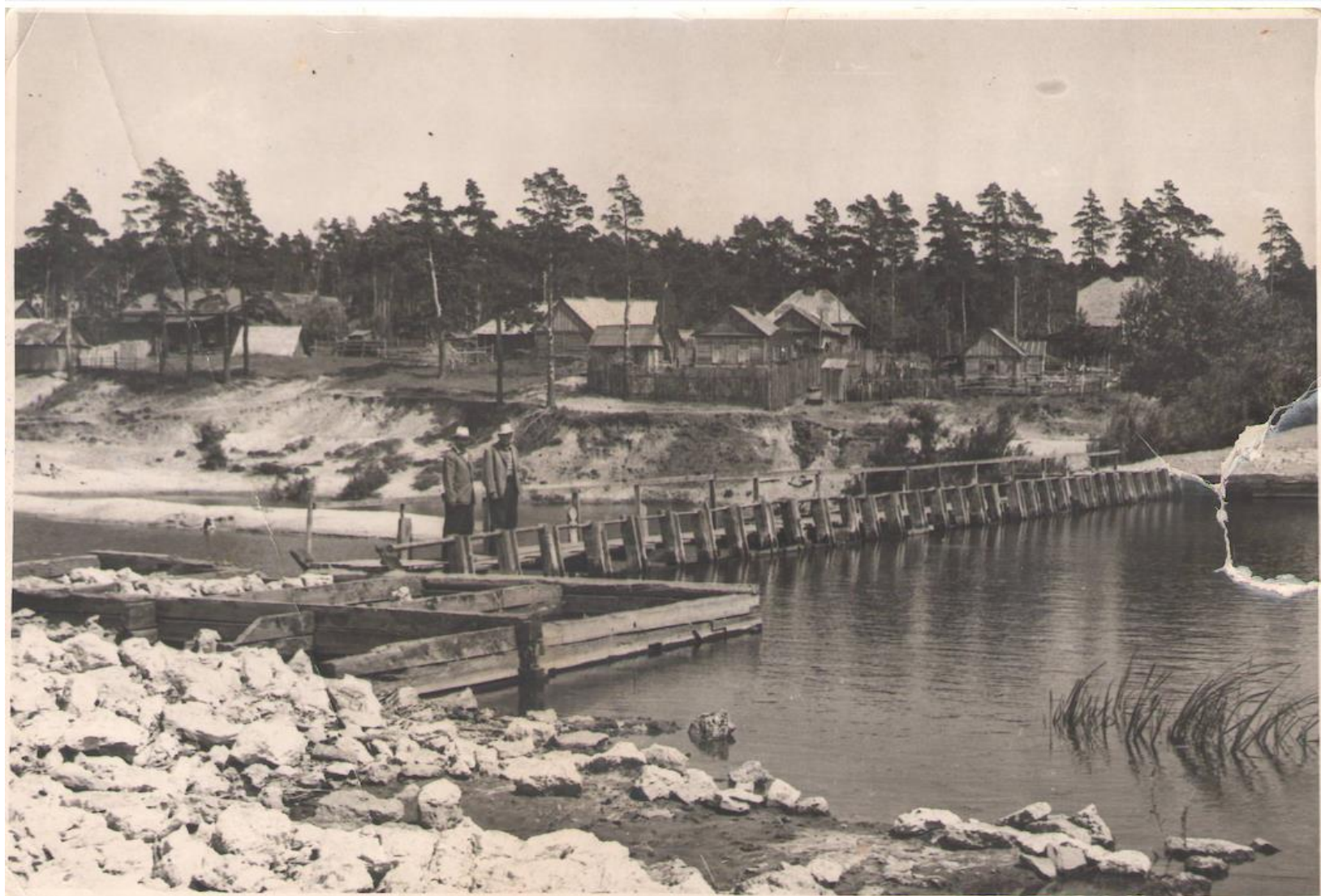
Тамбовская плотина в Пригородном лесу, 1935 г.