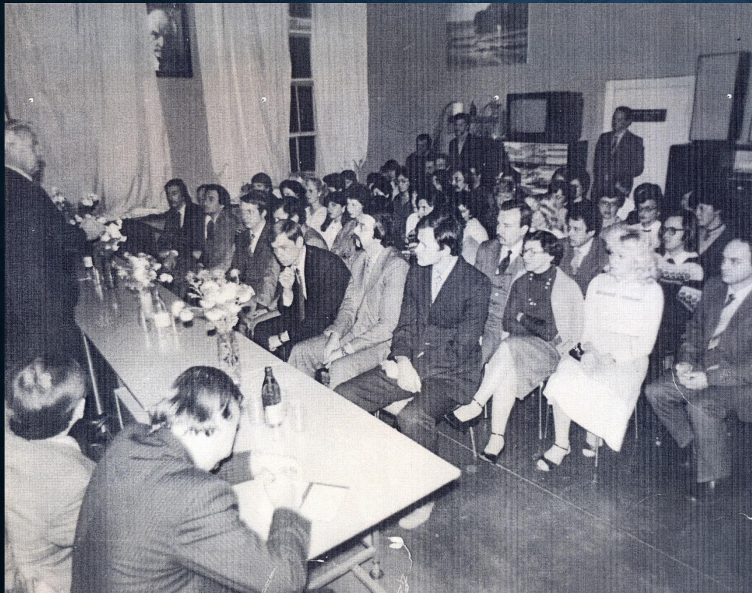
Собрание сотрудников Вычислительного центра ТИХМа