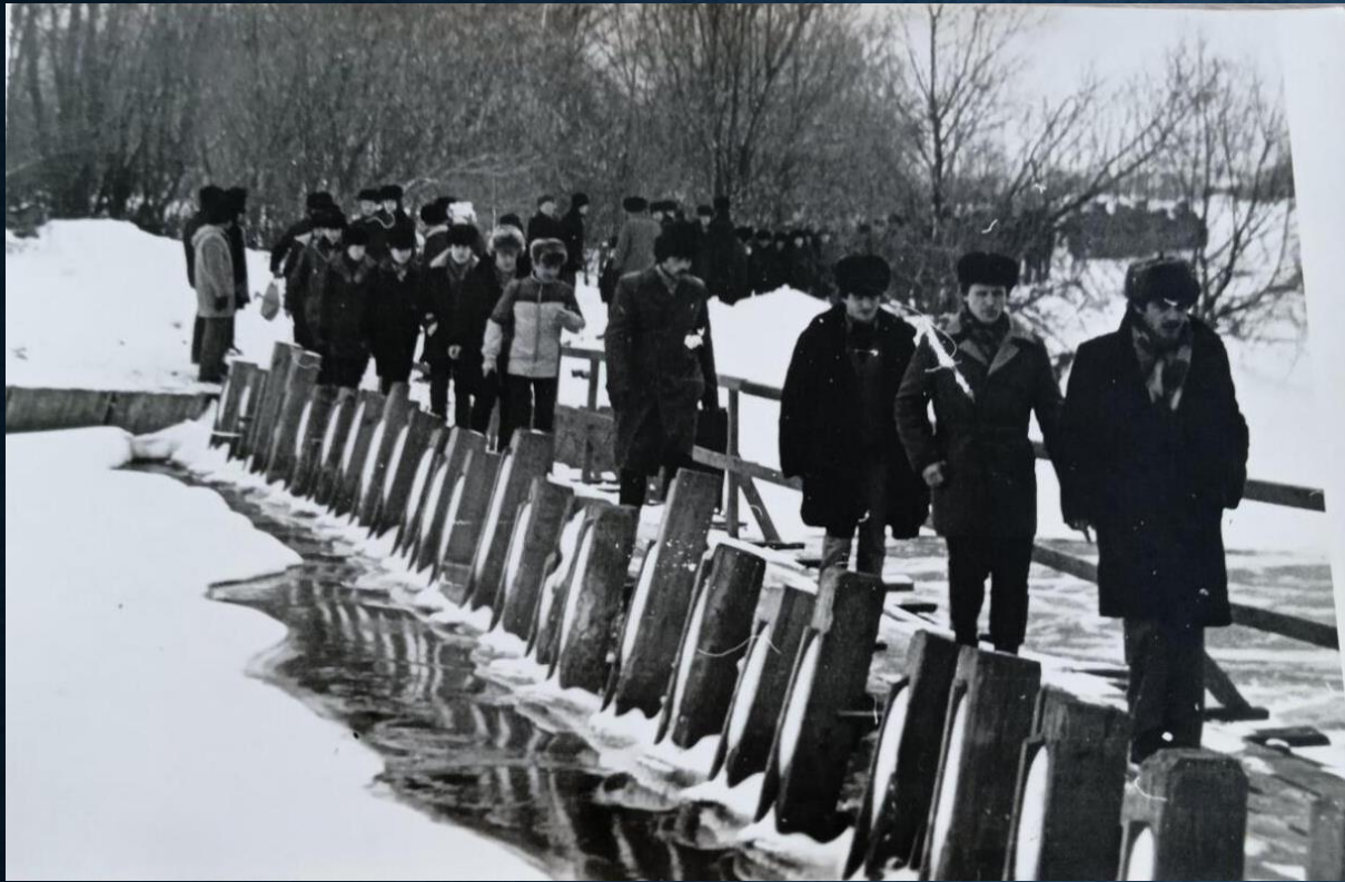
Учения по гражданской обороне начала 1980-х гг.