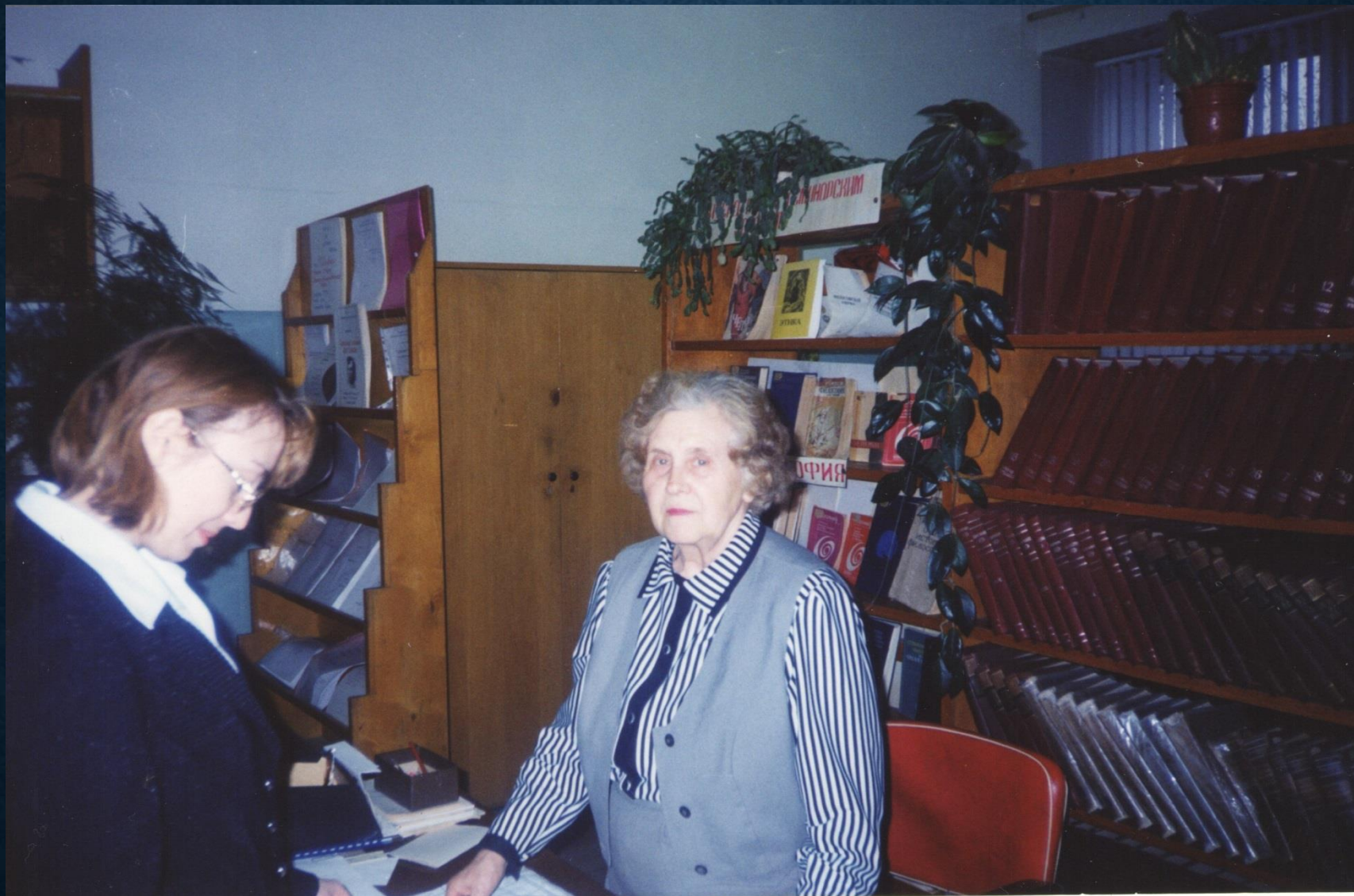
В кабинете кафедры истории и философии на рубеже веков