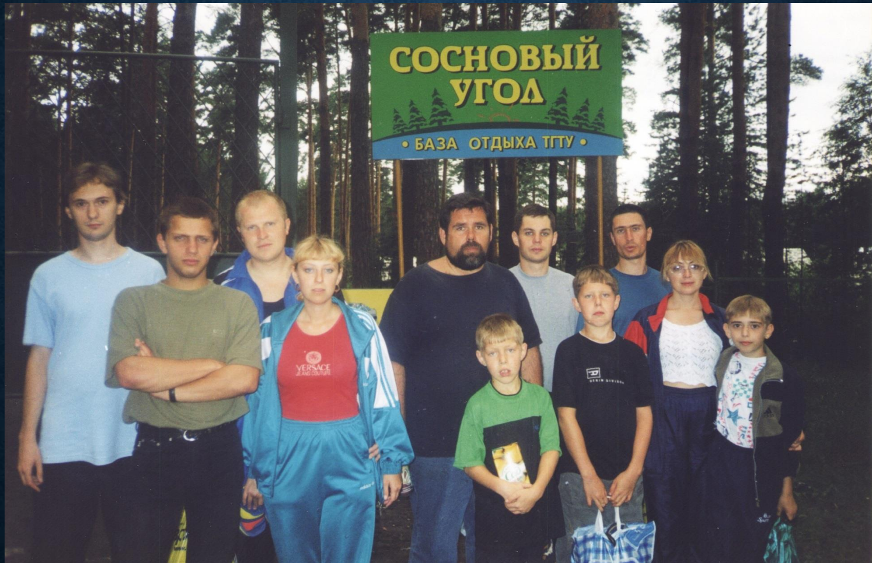
Во время отдыха сотрудников кафедры "История и философия", 2003 г.