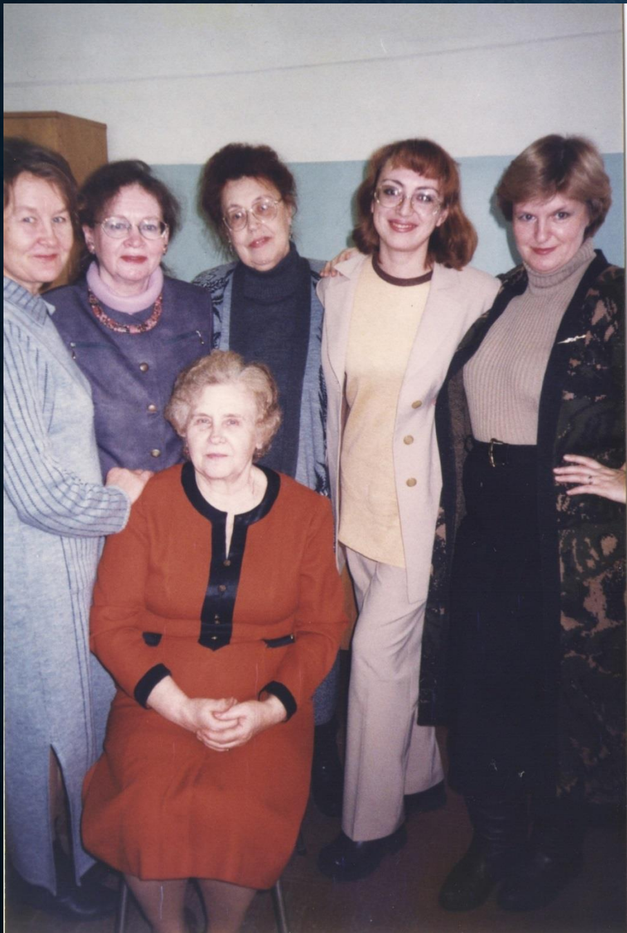
"Женская половинка" кафедры «История и философия» на рубеже веков