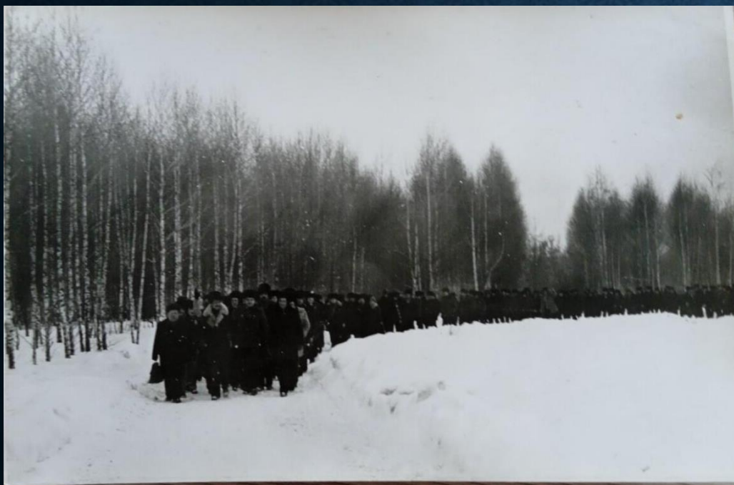
Учения по гражданской обороне начала 1980-х гг.